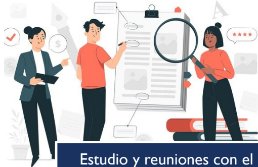
Estudio y reuniones con el personal investigador UAH