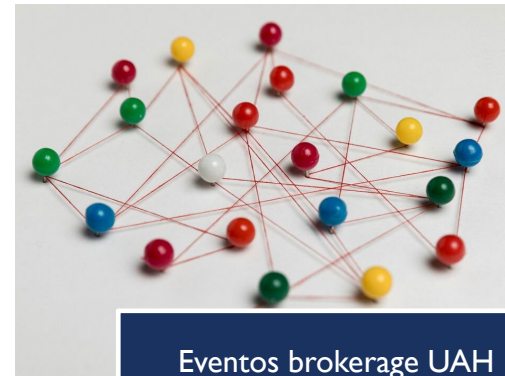
Eventos brokerage UAH