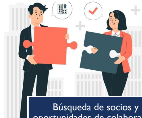
Búsqueda de socios y oportunidades de colaboración